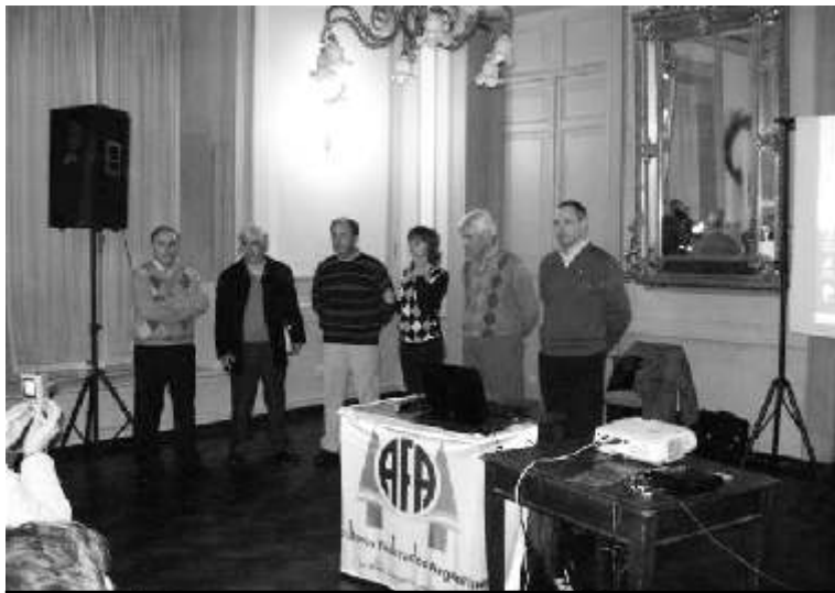
A.F.A. hizo su presentación en el Centro de Comercio

una cooperativa comercializadora de granos, oleaginosos y hacienda, informando que A.F.A. está instalando una planta de silos en la cercanías del cruce de la rutas 9 y 191 con la intención de establecerse y operar en nuestro Partido, tal como ya lo han hecho en numerosos puntos del sur de Sante Fé, Córdoba, Norte de Buenos Aires y Entre Ríos. Dado que es política de la Cooperativa interactuar fuertemente con las poblaciones con las que se relacionan, nos han elegido para tal propósito, es por ello que presentan y se acepta de inmediato una solicitud de asociación a nuestro Centro, a efectos de contar con un lugar para las reuniones periódicas de