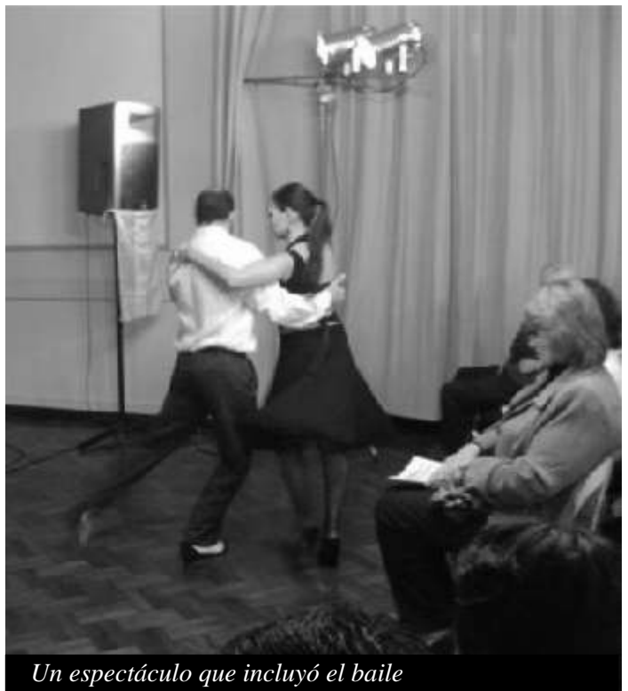
Un espectáculo que incluyó el baile

Como es costumbre en este tipo de acontecimientos, la entrada fue libre y gratuita.