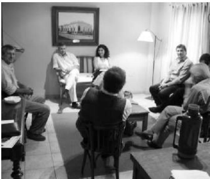
Clarín, La Nación y La C.D. del Centro de Comercio

Los visitantes se comprometieron y cumplieron en remitir abundante documentación al respecto y de nuestra parte se les ofreció la posibilidad de contar con nuestros salones en caso de querer ofrecer charlas explicativas a la comunidad y además la disposición de la C.D. en pleno de recibirlos para escuchar sus argumentos y evacuar dudas, estando previsto que esto último se concrete en breve.